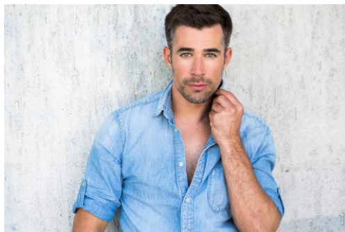
Jo Weil kommt es im Urlaub auf Abwechslung an.

Luxusimmobilienmakler Marcel Remus , bekannt aus der VOX Sendung „mieten, kaufen, wohnen“ beschreibt seinen Urlaub als „ein kurzes Durchatmen von meinem täglichen Business-Jogging und den Kunden-Terminen“. Seine bevorzugte Urlaubsart sind Rundreisen, bei denen er jeden Tag etwas Neues entdecken kann. Auch für Schauspieler und Moderator Jo Weil , aus der ARD Vorabendserie „Verbotene Liebe“ bekannt, sollte der Urlaub Abwechslung bieten: „Mal Großstadt-Abenteuer, mal Nichtstun am Strand - die richtige Mischung macht's.“ Unter seinen liebsten Reisezielen ist Großbritannien. In