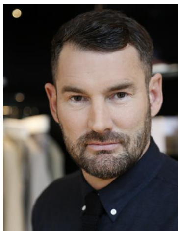
Michael Michalsky weilt regelmäßig auf Ibiza.