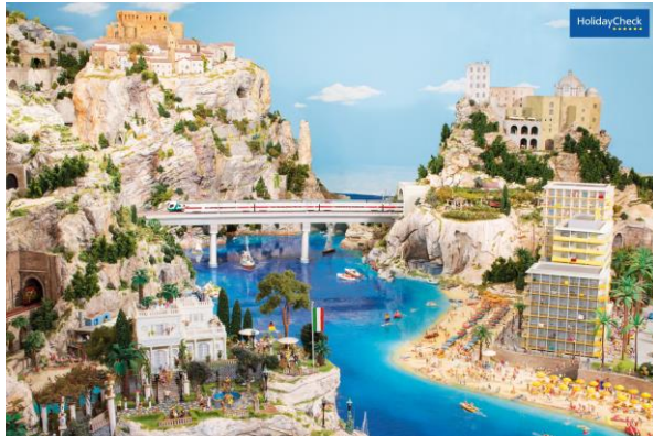
Urlaubsparadies: Das rechts vom Meer gelegene Paodato Troppo auf der Italien-Fläche im Miniatur Wunderland mit Blick auf die Schweizer Berge.

Ab sofort nimmt auch das kleinste Hotel Deutschlands, das Paodato Troppo im Miniatur Wunderland in Hamburg, Bewertungen auf HolidayCheck entgegen. Der Fantasie der Internetnutzer sind dabei ausnahmsweise keine Grenzen gesetzt: Wer bis zum 22. April sein kreatives Urteil abgibt und von seinem imaginären Aufenthalt berichtet, hat die Chance auf ein Mini-Ich in der größten Modelleisenbahnanlage der Welt.